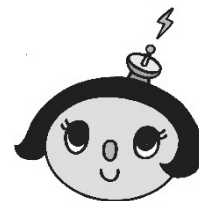
高島市成年後見サポートセンター